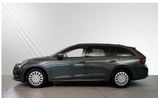
ŠKODA Zentrum Kiel schmidt&hoffmann mobilität