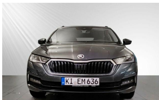
ŠKODA Zentrum Kiel schmidt&hoffmann mobilität