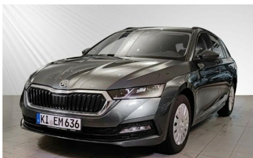
ŠKODA Zentrum Kiel schmidt&hoffmann mobilität