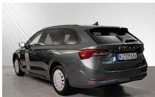
ŠKODA Zentrum Kiel schmidt&hoffmann mobilität