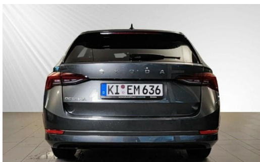
ŠKODA Zentrum Kiel schmidt&hoffmann mobilität