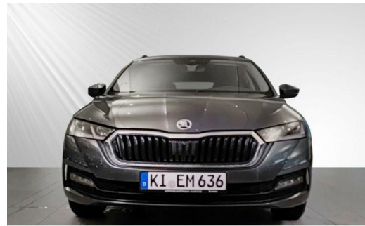
ŠKODA Zentrum Kiel schmidt&hoffmann mobilität