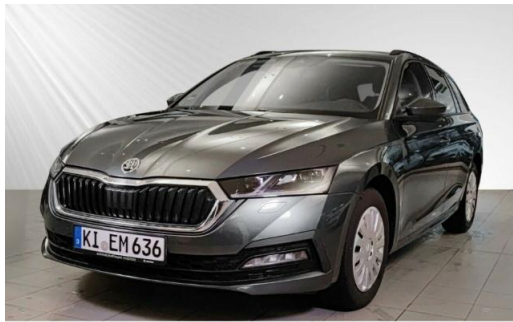
ŠKODA Zentrum Kiel schmidt&hoffmann mobilität