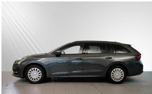
ŠKODA Zentrum Kiel schmidt&hoffmann mobilität