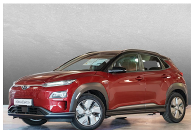
EULER GROUP HYUNDAI